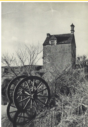
Carte postale ancienne.