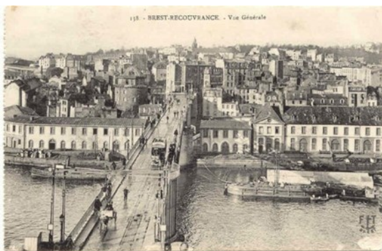
Recouvrance avant la Seconde Guerre mondiale